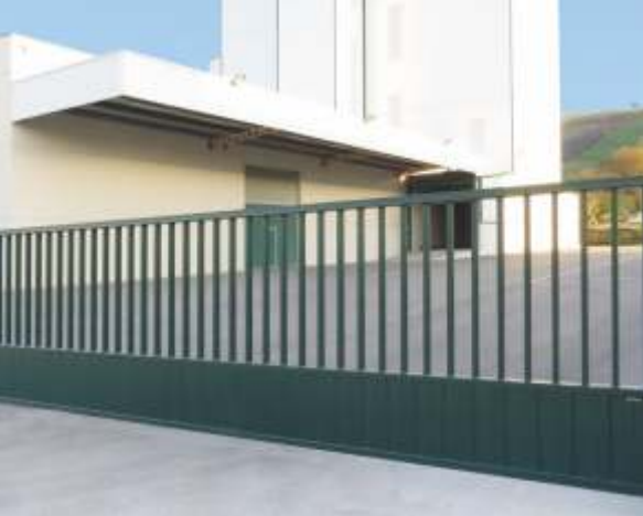
PUERTA CORREDERA CANCELA INDUSTRIAL