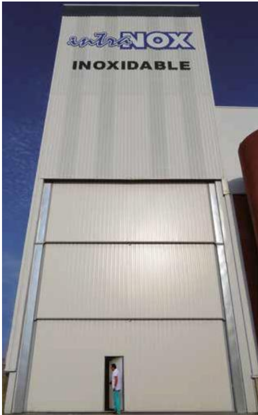
PORTE GUILLOTINE INDUSTRIELLE